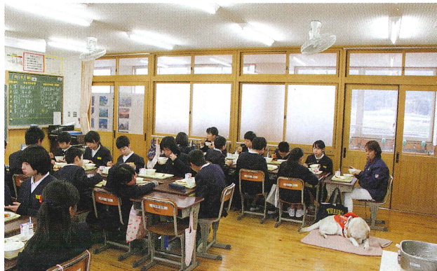
盲導犬学校キャラバン（福祉教育）