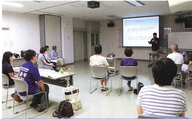
ボランティア養成講座（手話奉仕員）