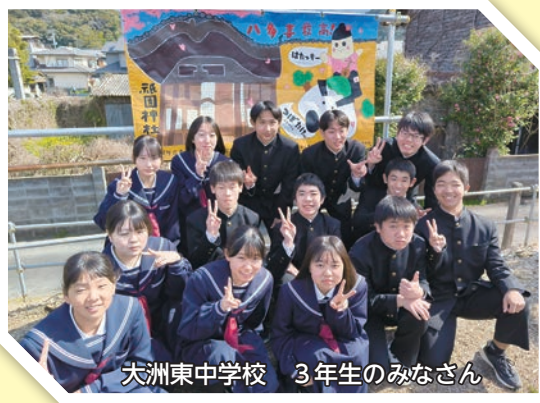
大洲東中学校 3年生のみなさん