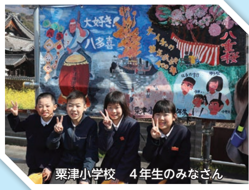
粟津小学校 4年生のみなさん