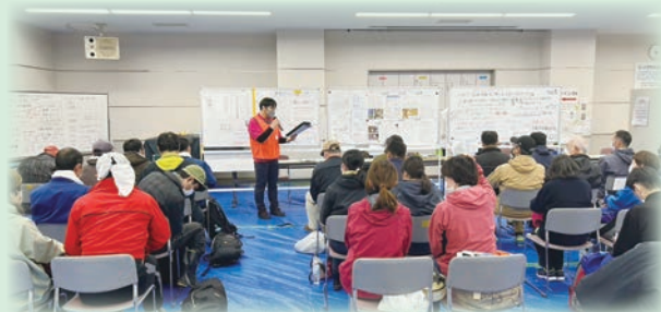
ボランティア参加者に対するオリエンテーション

四国ブロック第6フェーズの派遣では、香川県内社協職員2名と愛媛県内社協職員2名が活動し、災害ボランティア参加者に対するオリエンテーション及び、支援ニーズに対するマッチング、支援ニーズの現地調査と支援規模の見立てなどを中心に活動しました。