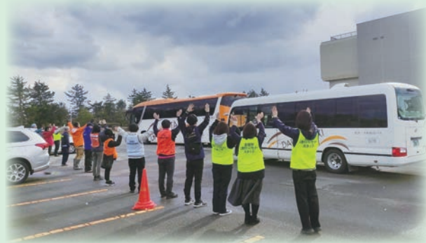
ボランティアさんの送り出し

最後になりましたが、この度の地震によって亡くなられた方々のご冥福をお祈りするとともに、被災された皆様の一日も早い復興をお祈りしています。