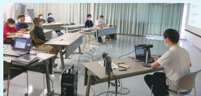
「実習報告会」(大洲市社協本所にて)