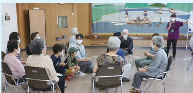
「やよいの会」で高齢者と小学生の交流会に参加