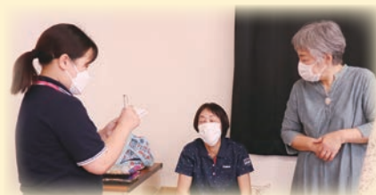
サロンで熱心に聞き取り中！

た。これらの視点を持つことは地域の課題を分析する上でとても重要になると学びました。今回の実習で得た様々な経験を今後の糧にし、勉学に励んでいきたいと思えます。