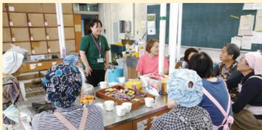
「肱南地区ふれあい弁当」の様子