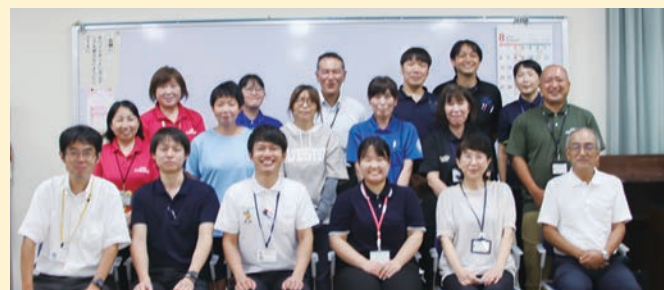
「実習報告会」(大洲市社協本所にて)

実習期間中に温かく受け入れてくださった地域の皆様、社協職員の皆様、関係機関の皆様、本当にありがとうございました。