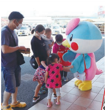
街頭募金介 クリアファイル募金➡