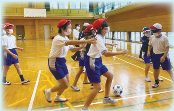
福祉体験教室でのブラインドサッカー