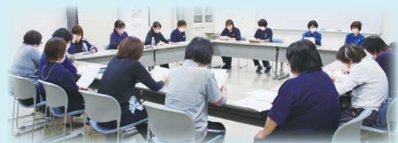
社協ヘルパーの勉強会