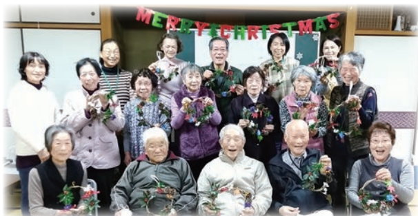
サロンでクリスマスリース作り★