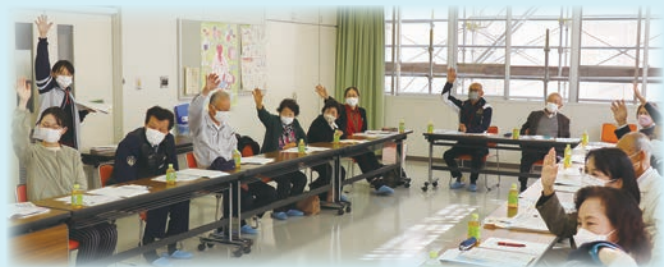
肱川地区の協議体会議