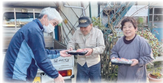
地域ふれあい事業

地区社協が主体となって実施している地域ふれあい事業・独居高齢者のつどい・独居高齢者料理教室などの小地域福祉活動に対し、支援・助成を行いました。