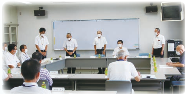
理事会での新会長挨拶の様子