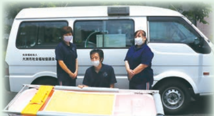
看護師を含めた3人で伺います( ^v^ )