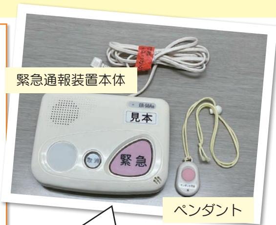
緊急通報装置本体