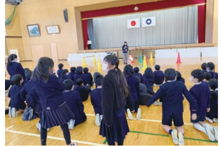
盲導犬が障害物をよけるお仕事の時、ユーザーと自分が一緒に安全に通れる幅の最短コースをその都度選んで歩いているのを実際に見て、驚く子どもたちです。