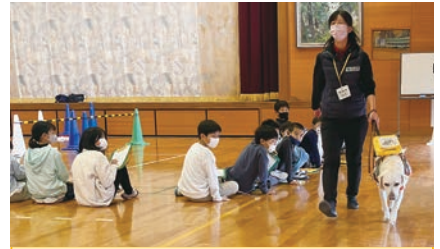
間近で盲導犬のお仕事の様子を見ることができました。