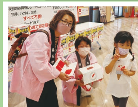
☞大洲市母子寡婦福祉連合会の皆 さんが、ピンクの法被を着て実施♪