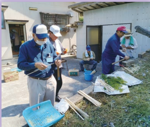
自然と男女で役割分担して作成中♪