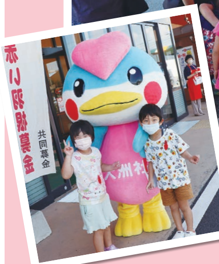
☞募金をした後に、うーちゃん と記念写真をパシャリ☆