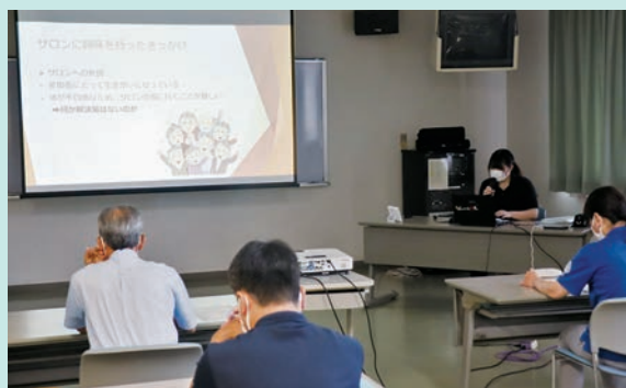
「実習報告会」の様子(社協本所にて)

コロナ禍という状況でも、たくさんの経験をさせていただき、大学では学ぶことができない実践的なことを多く学ぶことができました。今後は、この経験を大学の講義や就職の際に生かしていきたいと思います。今回の実習に関わってくださった皆様、本当にありがとうございました。