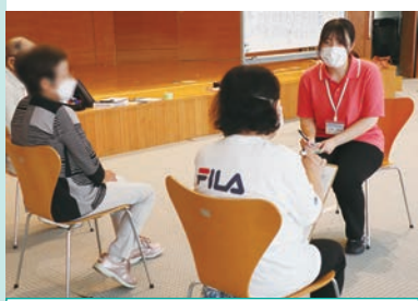
サロンでの聞き取りの様子

実習では、特にサロン活動に焦点をあてて取り組みました。3か所のサロンに参加させていただ