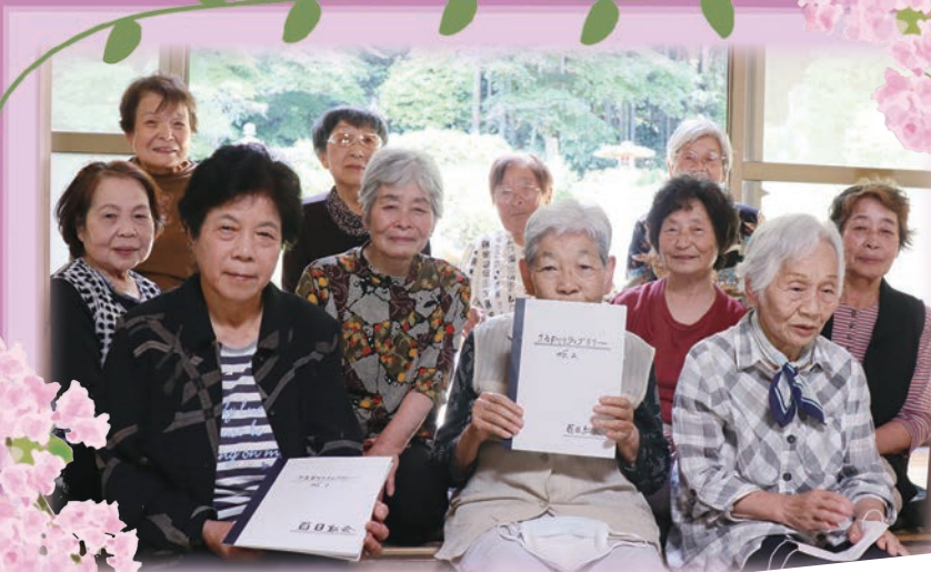
↑撮影時のみマスクを外しています