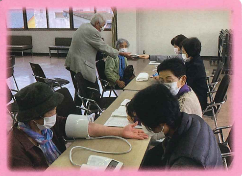
地域の独居高齢者のつとめ