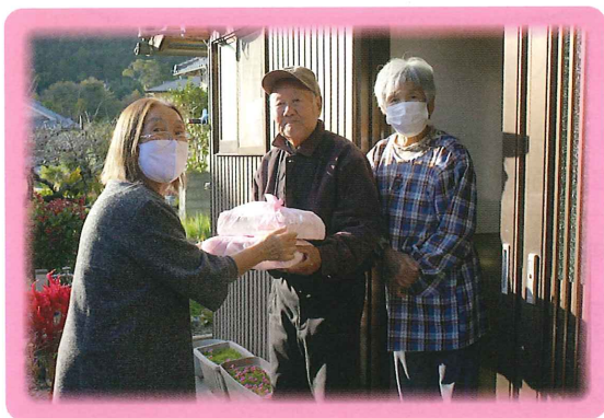
高齢者ふれあい食事サービスで配食