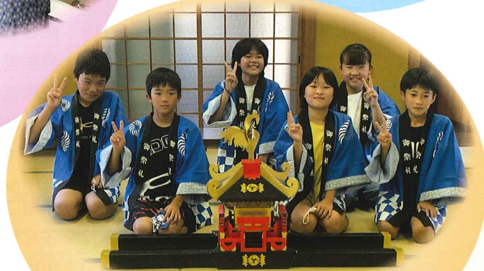
↑ お祭りの子どもみこしやハッピー(平地区)