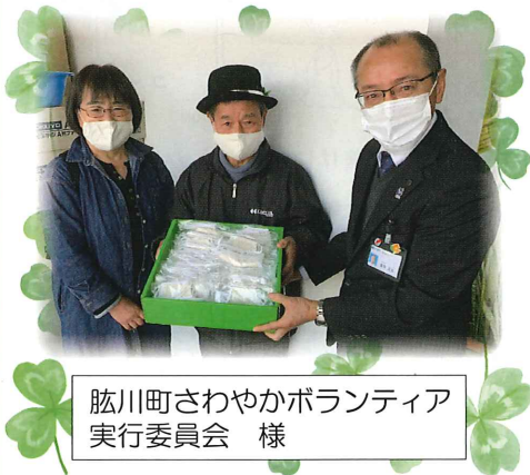
肱川町さわやかボランティア 実行委員会様