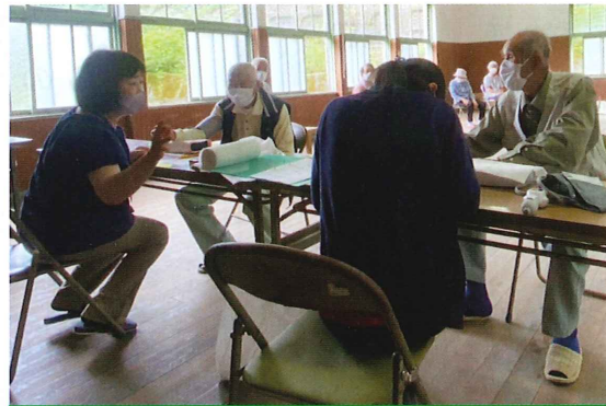
↑血圧は、感染防止対策でキッチンペーパーを腕に巻いての測定です。

りました。報提供等が有りました。等）の相談先や在宅福祉サービスの提供等が有りました。