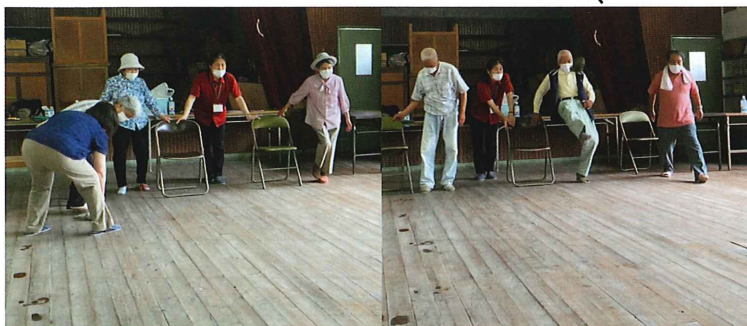
↑「今日は練習。今度は大会だ!」と、童心に帰ってスリッパを飛ばしました。

りました。報提供等が有りました。等）の相談先や在宅福祉サービスの提供等が有りました。