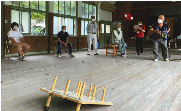
↑水分補給をしながら、体操やゲームをしました。