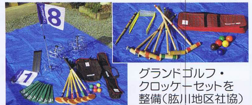
グランドゴルフ・ クローカーセットを 整備(肱川地区社協)

たくさんの方々が、 豪雨災害後にボラン ティアセンターに復 興支援の為 かけつけて下さり、運 営経費にも使われまし た。