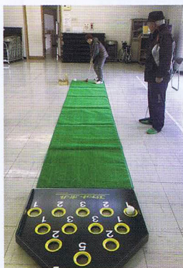
スクットボールセットや バランスボールを整備 (喜多地区社協)