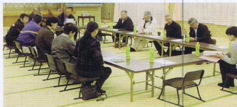
(大川保健福祉協議会) 座椅子用の長机を整備