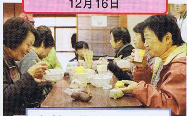
「あったか たいら」当日 12月16日