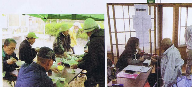
在宅介護支援センターひまわりの 協力により、血圧・握力測定と健 康相談も実施されました。

「あったか たいら」を終えての感想 (二部抜粋) ●「あったか たいら」を開催して どのように感じましたか？ ・天候不順にも関わらず、たくさん の人に来て頂きありがたかつ た。みんなの協力ですばらしい イベントができた事にとっても感 謝しています。 ・準備期間の短く中で開催できた のは、日頃からサロン活動を行っ ていたからだと思います。 ・協力会員をはじめ、社協やボラン ティアの方々や交流しながら開 催でき、和やかに和気あいあい の場となったと思います。子ど もが少なかったのが少し残念。