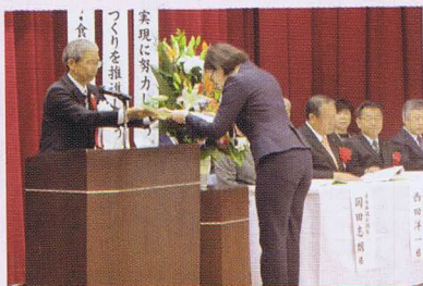
大洲市社協会長表彰のようす