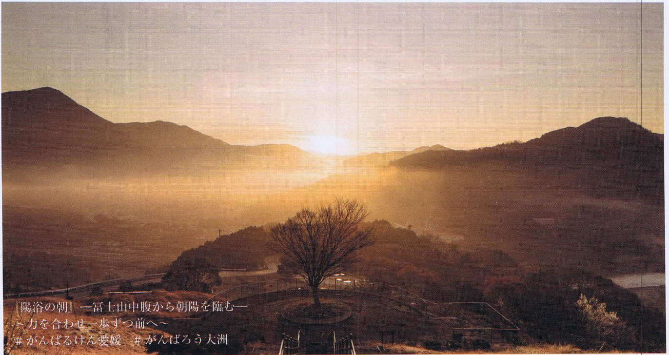
「陽浴の朝」—富士山中腹から朝陽を臨む— ～力を合わせ一歩ずつ前へ～ #がんばるけん愛媛 #がんばろう大洲