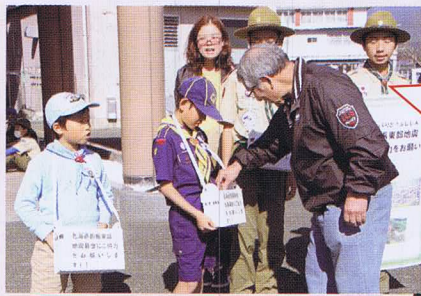
大洲オールド・バンドさん による生演奏♪ メンバー全員で奏でる音色 に癒されました。

「赤い羽根共同募金運動にご協 力をお願いします！」ボイス カウトのみんなが元気よく呼び かけていました。ご協力いただ きましたみなさま、ありがとう ございました。