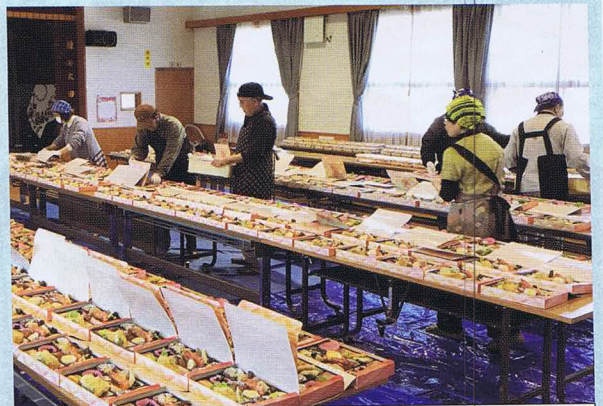
写真は地区社協事業の一例で、ふれあい食事サービスの様子です。社協会費は子どもから高齢者等を対象としたさまざまな交流活動などの財源になっています。

会費を納入された地域の皆さんが会員です。その地区の代表として、民生児童委員、在宅福祉推進員、自治会、婦人会、老人クラブ、公共施設関係者、その他地域の様々な団体などを中心に運営されています。様々なネットワーク（連携）を生かして、地域内の福祉問題の把握と解決に向けて、地域福祉活動に取り組む団体です。大洲市社協は地区社協活動に対し、助成や事業費配分等を行い、地域住民グループによる自発的なボランティア活動を支援しています。