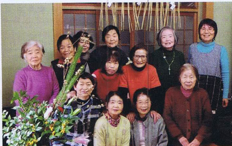
新谷地区 新谷町サロン

喜多地区 田口ことぶきサロン 概ね65歳以上の方を対象に、「お話しして元気になるためのつどい」を年6回程度開催しています。お世話人さんの協力で、手料理を毎回振る舞い、おしゃべりや昔の遊びを通して、皆で楽しみながら地域コミュニティを築いています。