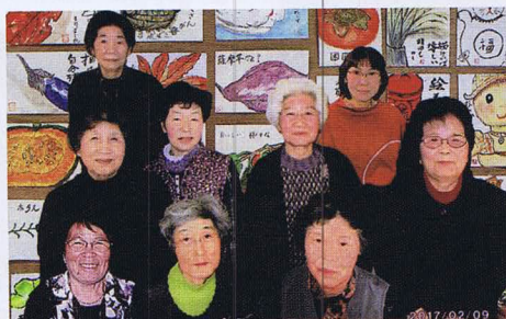
平野地区 絵手紙サロン