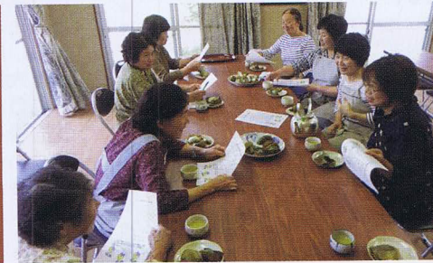
三善地区 多田ふれあいサロン