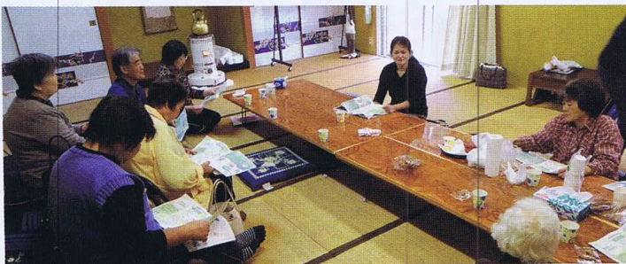
三善地区 ひまわり

サロンを立ち上げたい、または、サロンについてもっと詳しく知りたいという方は、大洲市社会福祉協議会 地域福祉係（☎0313）までお問い合わせください。