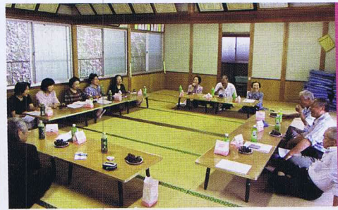
肱川地区 とんどサロン 山鳥城 やまどり

喜多地区 田口ことぶきサロン 概ね65歳以上の方を対象に、「お話しして元気になるためのつどい」を年6回程度開催しています。お世話人さんの協力で、手料理を毎回振る舞い、おしゃべりや昔の遊びを通して、皆で楽しみながら地域コミュニティを築いています。