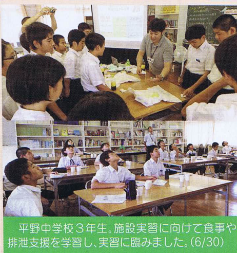
平野中学校3年生。施設実習に向けて食事や排泄支援を学習し、実習に臨みました。(6/30)