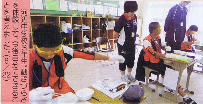
河辺中学校3年生。動きつりあを体験して今後自分にできることを考えました。(6/22)

大洲市社会福祉協議会では、一人ひとりを尊重し思いやりの心を持って助け合い、共に生きる人間の育成をめざす福祉教育の一環として、福祉に携わるきっかけづくりや福祉をより身近に感じてもらうための様々な企画を行っています。このような学習を続けていくことで、学校や地域で「自分に何かできることはないか」等気づきを得られるような体験学習をめざしています。