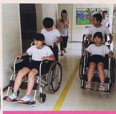
河辺小学校3～6年生。体育館から校舎に移動しました。安心して乗ってもらえるようにコミュニケーションをとっていました。(6/22)