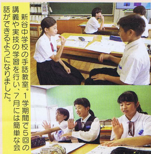
新谷中学校の手話教室。1学期間で5回の講義や実技の学習を行い、7月には簡単な会話ができるようになりました。