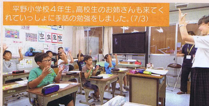
平野小学校4年生。高校生のお姉さんも来てくれていっしょに手話の勉強をしました。(7/3)

大洲東中学校3年生のふるさと学習。手話等の情報支援ボランティアは、えひめ国体・全国障がい者スポーツ大会でも活躍します！下の写真左は点字教室、右は手話教室の様子。この後車いす・高齢者疑似体験学習を経て、施設実習に臨みました。(5/23)