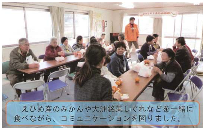
えひめ産のみかんや大洲銘菓しぐれなどを一緒に食べながら、コミュニケーションを図りました。

石巻市内にある女川町と石巻市を結ぶバイパス予定地に建てられた仮設住宅に居住する住民を対象に、二か所の集会所で同時開催し、合計で四十八名の方に参加していただきました。当日は、地域住民の方々にもボランティアとして運営をサポートしていただきました。愛媛県の特産品であるミカンや新宮茶、しぐれなどに舌鼓を打ちながらわきあいあいとした雰囲気の中で交流を深めました。