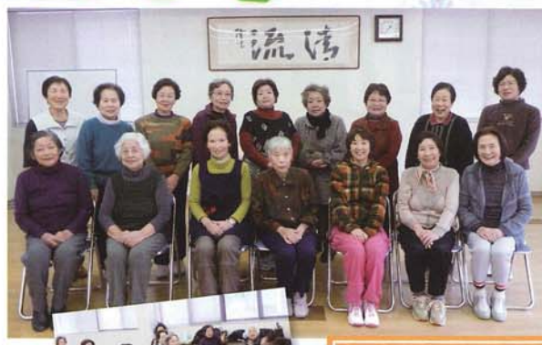
袖木げんきサロン (肱南)