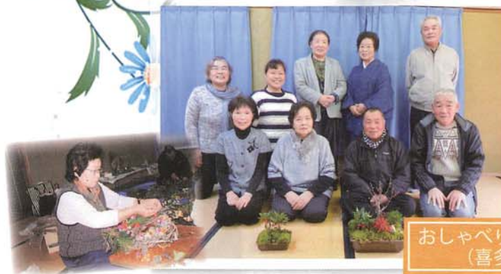
おしゃべりサロン (喜多)