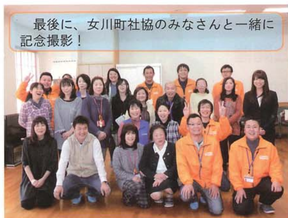
最後に、女川町社協のみなさんと一緒に記念撮影！

最後になりましたが、今回のサロン『えひめ茶屋』の開催のために大洲の名産品を提供していただきました大洲商工会議所をはじめとする関係者の皆様ありがとうございました。