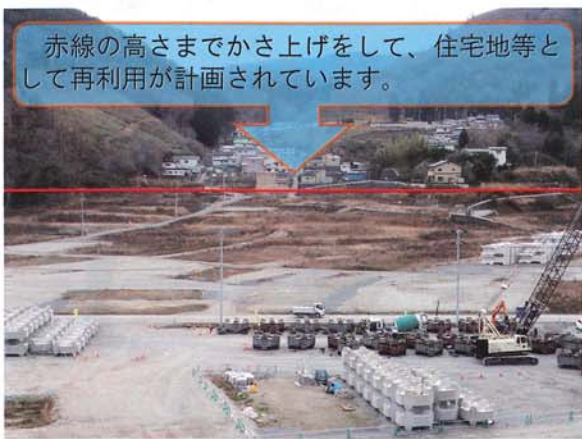
現在の女川町内の様子