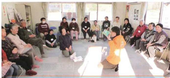
サロン『えひめ茶屋』の様子。 レクリエーションで方言クイズを行い、お互いの言葉の違いをネタに楽しみました！！

今回の活動の一つの大きなテーマとして、住民と交流する中で、現在の女川町住民が抱えている生活課題の把握やニーズ調査を行い、今後、女川町社協が見直しを予定している地域福祉活動計画の策定に繋げられるような社協活動の支援をすることを掲げさせていただきました。そこで今回は、愛媛県内の社協職員メンバーが企画し、女川町社協や実施地区の自治会等の協力を得てサロン『えひめ茶屋』を開催しました。一日限りの開催ではありませんが、今後住民の主体的な取り組みの一つとして交流・憩いの場が続いていくことを願い実施させていただきました。