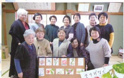
絵手紙サークル 椿の会 (喜多)