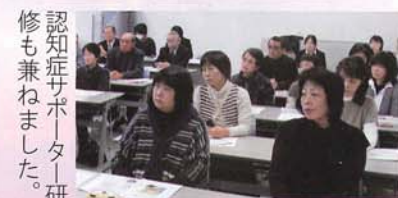
認知症サポーター研修も兼ねました。