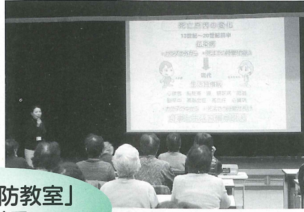
「介護予防教室」の様子