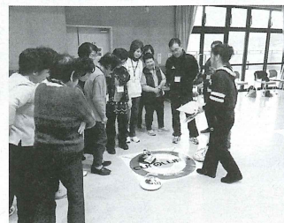
「レクリエーション教室」の様子