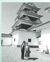
大洲城にもご案内しました。

十月十五日(月)、内子町において南予地区社協研修会が開催され、講師として東日本大震災被災地である宮城県女川町社協の会長と職員の方が来県されました。今年八月に愛媛県内社協職員がボランティアバスで女川町へ伺い交流しましたが、その折、大洲のいもたきを食べてもらったりしたご縁で講師の方々を大洲にもお招きし、短い時間ではありましたが市内をご案内しました。震災の記憶が薄れつつある事が危惧される中、今後被災地の方々との交流の糸を切らさぬよう、このご縁を大切にし、思いをこめたいと思います。