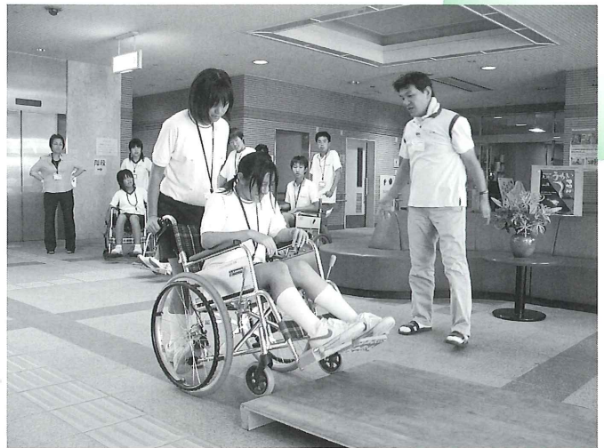
車椅子の使い方説明