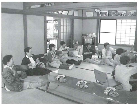
サロン活動の様子

閉じこもりがちの高齢者等が身近な集会所において、おしゃべりや体操、ゲーム等を行い、人とのふれあいを通じて、孤独感の解消や社会参加による生きがいづくり等を目的に、地域の住民とともにつくる「ふれあい・いきいきサロン」の支援を行いました。