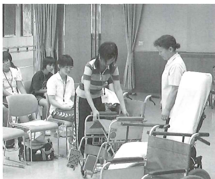
事前説明会の様子