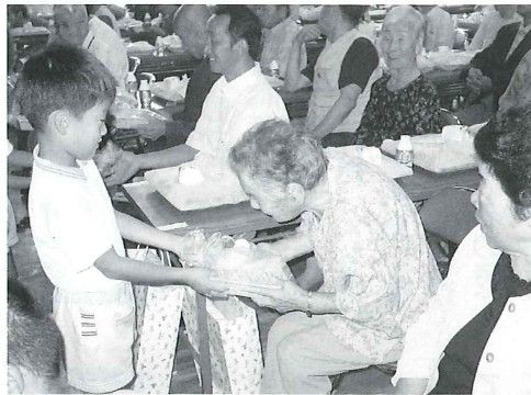
長浜地区敬老会の様子