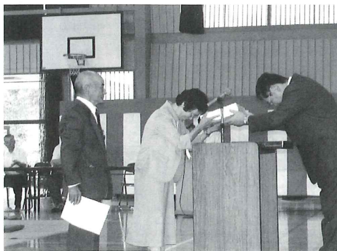
河辺地区敬老会の様子