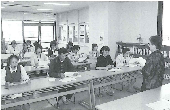
朗読ボランティア養成講座の様子

参加された受講生の方々をみていると、年々、福祉やボランティア活動に対する意識が高まってきているのを感じます。