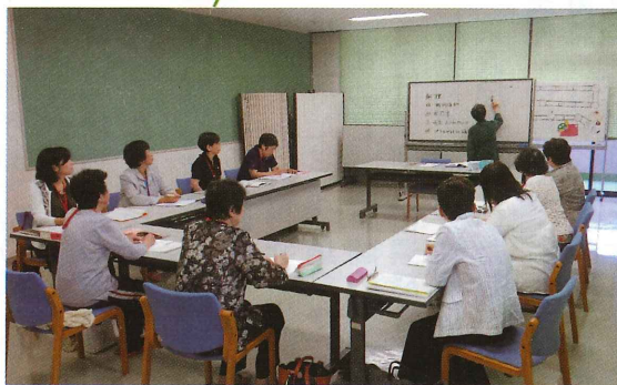
音声訳ボランティア養成講座