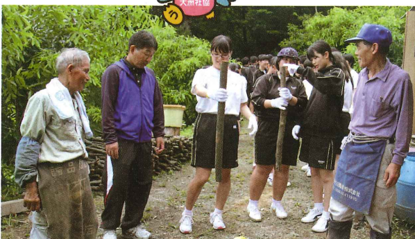
大川・菅田地域住民と肱東中生徒による炭焼き体験教室(福祉教育)