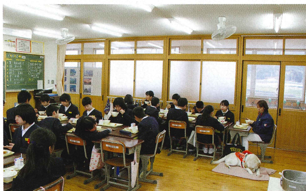
盲導犬学校キャラバン(福祉教育)