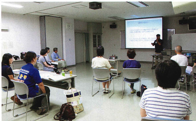
ボランティア養成講座(手話奉仕員)