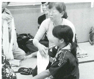
↑三角巾を利用しての骨折応急処置