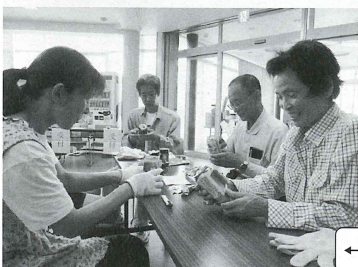
←↑災害時ランタン作り