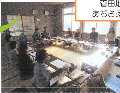
菅田地区 あぢさゐの会