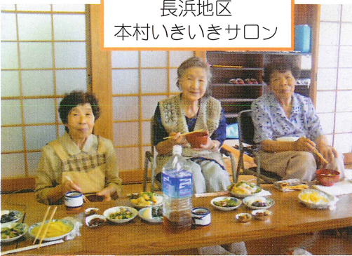
長浜地区 本村いきいきサロン