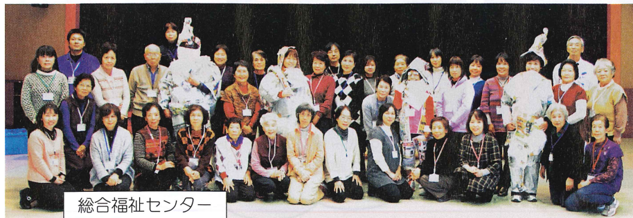
総合福祉センター