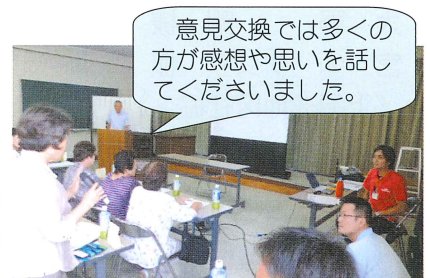
意見交換では多くの方が感想や思いを話してくださいました。