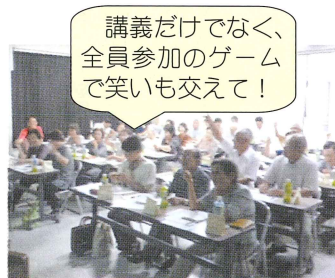
講義だけでなく、全員参加のゲームで笑いも交えて！