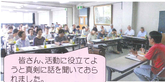
皆さん、活動に役立てようと真剣に話を聞いておられました。

今後も協力会員の活動を盛り立てていけるような「つどい」を企画していければと思っています。