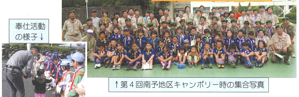
↑ 第4回南予地区キャンポリー時の集合写真