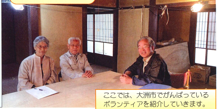
ここでは、大洲市でがんばっているボランティアを紹介していきます。

事務所の中の写真です。只今大幅改装中。将来は入居拒否されたりで住む場所が決まらず困っている障がい者が入れる寮にしてもいいね等色々な話をしています。