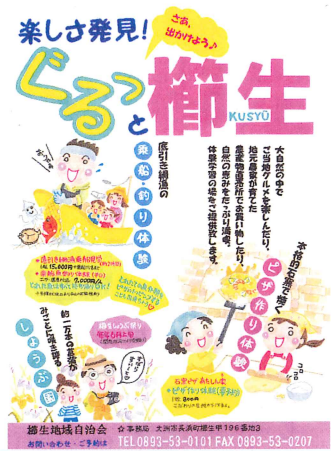
↑櫛生ピザ焼き体験チラシ

更にも、見学が出来る化粧品工場があったり、身近でありながらまだまだ素敵な見どころがたくさんある長浜へ、お出かけされてみてはいかがでしょうか。