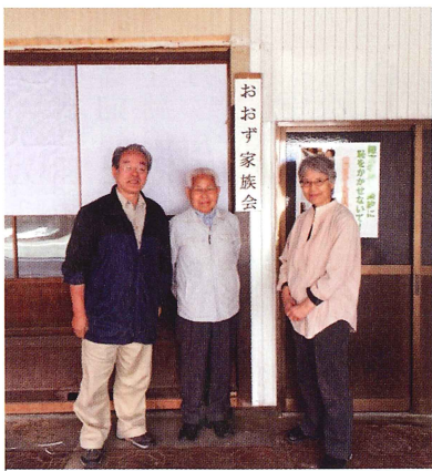
こちらは事務所玄関前です。

このような考えで活動しているその先に、障がい者が安心して暮らせる世の中になることを切に願っています。