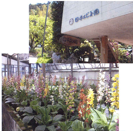
↑日本エビネ園。 とってもきれいに咲いています。

長浜高等学校の水族館や青島地区の猫で有名になった長浜ですが、他にも沖浦地区の沖浦観音まつり、櫛生小学校跡にできたピザ焼き体験施設、同じく櫛生地区の菖蒲園&菖蒲祭り、風蘭を栽培しておられるお宅(観覧させて頂けます)、須沢地区の日本エビネ園など、実にたくさんのお見どころがあります。