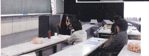
平成25年12月、松山市東雲短大に於いて開催された平成25年度発達保障講座の様子。 「一人ひとりが人生の主人公」と題して滋賀大学 教育学部教授 白石恵理子先生のお話を伺いました。