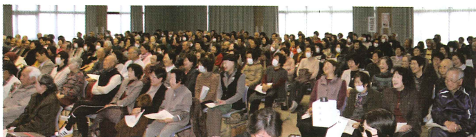
笑いあり、涙ありのお話で、最後まで楽しく聴かせていただきました。

だったそうです。そしてまた、子育てをしながら、お父様を支え続けたお母様の存在も大変大きかったと言われました。