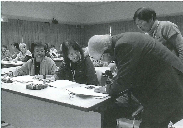
たくさんの方の参加があり、和やかな雰囲気の中行われました。(総合福祉センター)