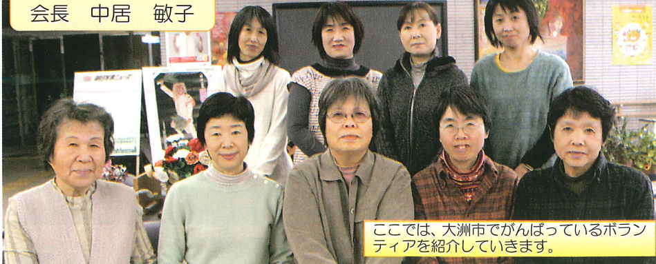
ここでは、大洲市でがんばっているボランティアを紹介していきます。