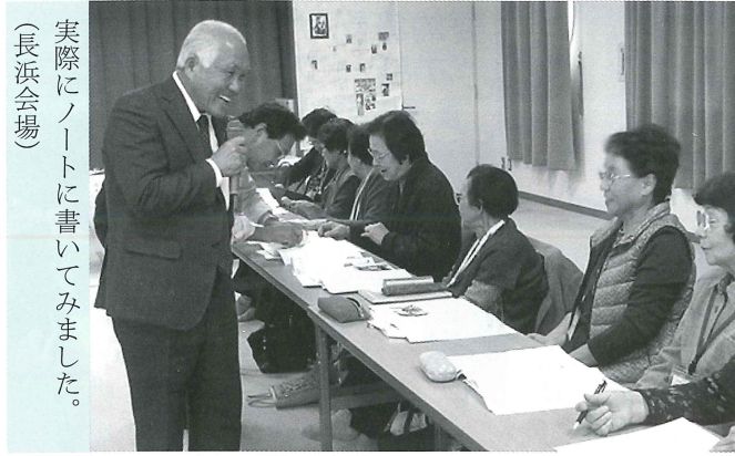
(長浜会場) 実際にノートに書いてみました。

あたたかい善意をありがとう ございました。感謝をこめて掲 載させていただきます。