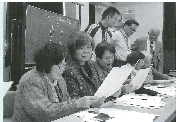
先生が整理した過去から現在までの写真を見せていただきました。(久米会場)

大洲市社会福祉協議会は、今後もお世話人交流会等を通して、ふれあい・いきいきサロンの活動が地域で楽しく継続していけるよう応援していきたいと思っております。 サロンについてのご質問、ご要望等ございましたら、大洲市社会福祉協議会までお気軽にお問い合わせください。