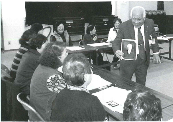
貴重な先生の遺影用の写真も見せていただきました。(新谷会場)