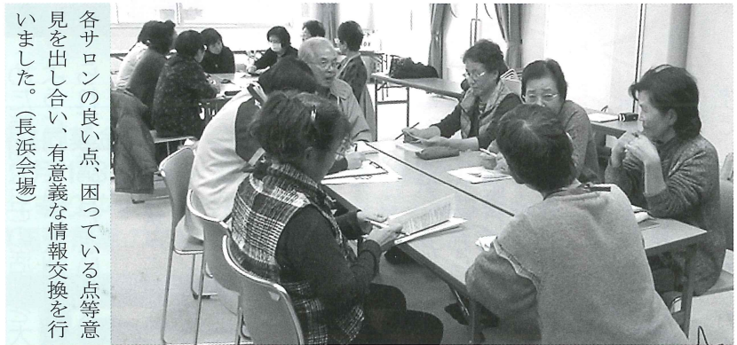
各サロンの良い点、困っている点等意見を出し合い、有意義な情報交換を行いました。(長浜会場)