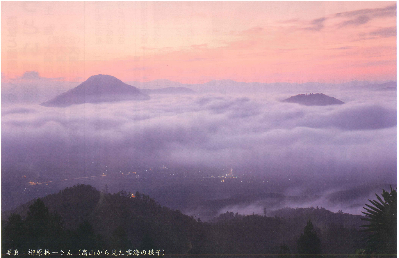
（高山から見た雲海の様子）