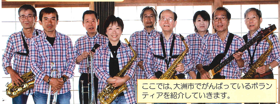
ここでは、大洲市でがんばっているボランティアを紹介していきます。