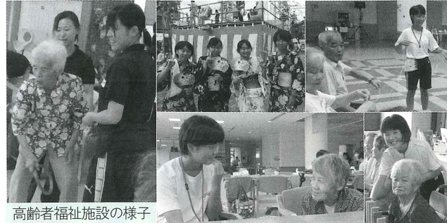
高齢者福祉施設の様子