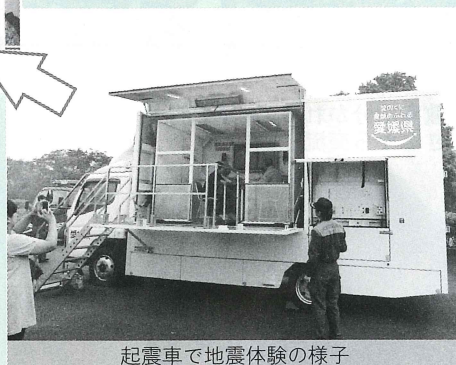
起震車で地震体験の様子

平成二十五年六月二十三日(日)、肱川河川防災ステーションにおいて、大洲市ボランティア連絡協議会主催「第九回災害ボランティア研修会」が開催され、六十名の参加がありました。 今回のテーマは「地震災害時の対応について」で、起震車にて「東日本大震災」時の地震が再現されました。体験した参加者は想像を上回る揺れの激しさに茫然としていました。その後、大洲消防署員の方を講師に地震災害時の対応についてのお話を聞き、心肺蘇生法やAEDの講習を受けました。このような災害講習や訓練は繰り返し受けて、いざという時に落ち着いて対応できるようにしておくことが大切であるとのことでした。