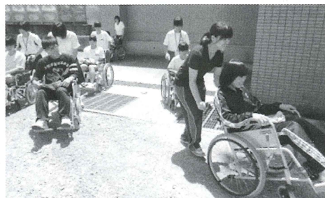
車椅子介助の様子