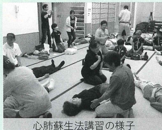
心肺蘇生法講習の様子