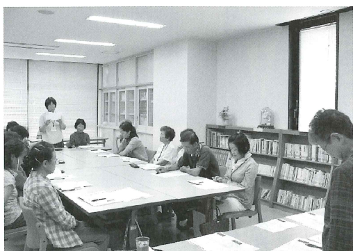
ボランティア講座の様子